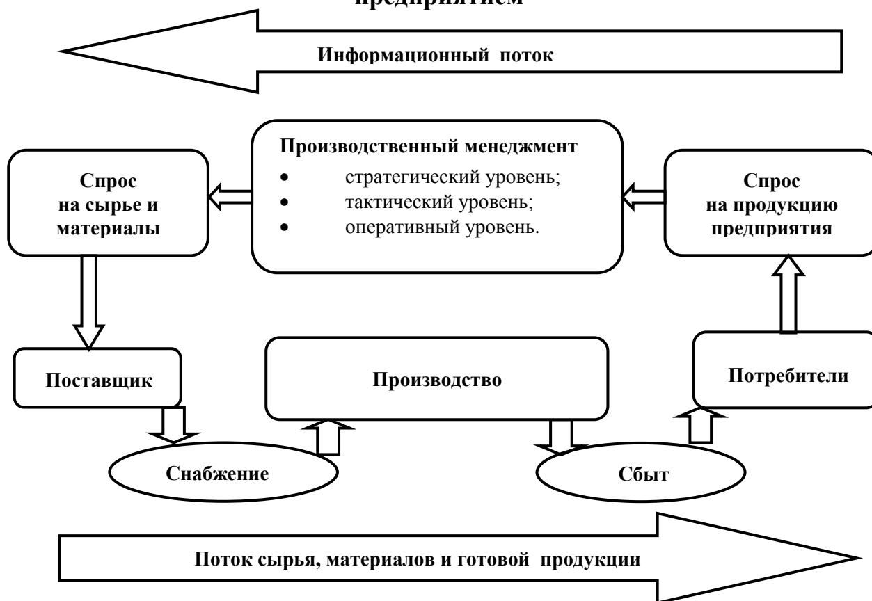
Рис. 1.1. Место производственного менеджмента в общей системе управления предприятием